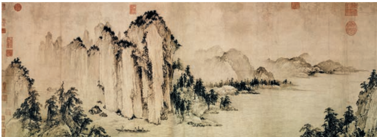
赤壁图 [金] 武元直 作

苏子曰：“客亦知夫水与月乎？逝者如斯，而未尝往也；盈虚者如彼，而卒莫消长也 ㉑ 。盖将自其变者而观之，则天地曾不能以