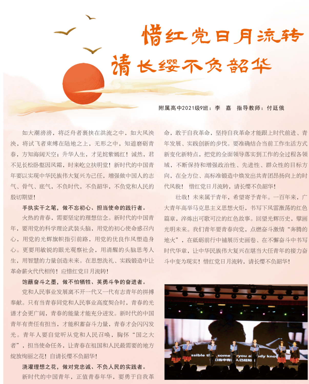
附属高中2021级9班：李 嘉 指导教师：付廷俄